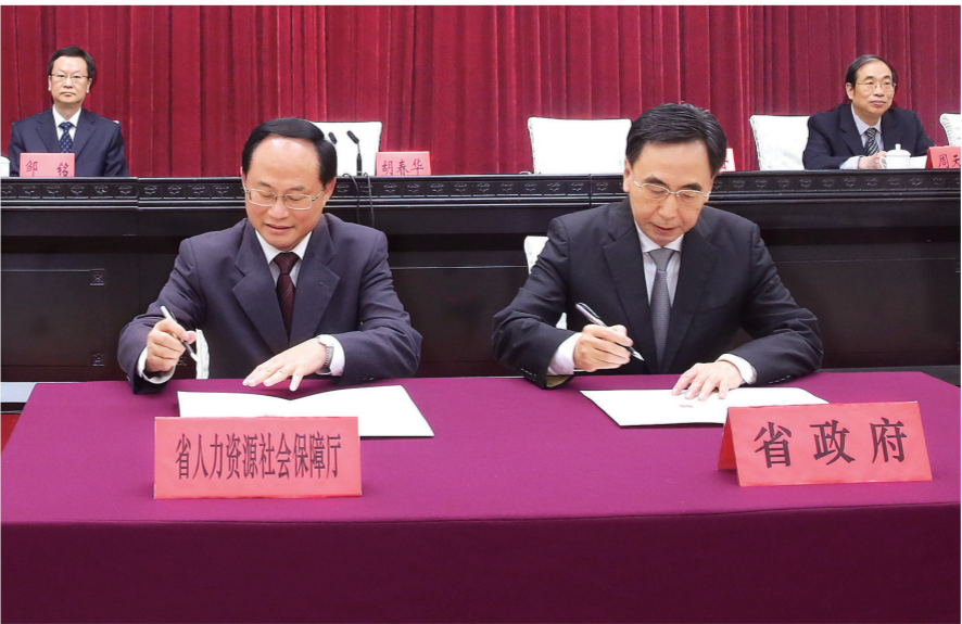
省长朱小丹(前右一)与省人社厅主要负责同志签订2016年度人口计生目标管理责任书