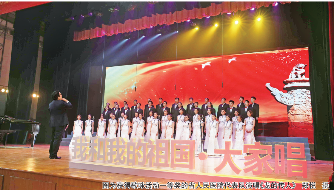
图获获得歌咏活动一等奖的省人民医院代表队演唱《龙的传人》