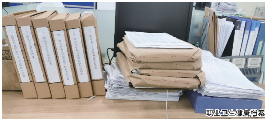
职业卫生健康档案