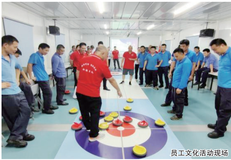
员工文化活动现场

在完善制度方面,深巴发布《职业健康安全管理规定》《EAP(员工心理关爱计划)管理办法》等近十项制度,推动健康企业建设工作常态化开展;将每年5月设为公共交通驾驶员关爱月,每年5月20日为公交驾驶员关爱日;以“微笑在深巴,关爱在身边”为主题,整合党建、工会、EAP、基层管理资源,持续开展员工关爱活动;在每周三开展“基层服务日”走访活动,