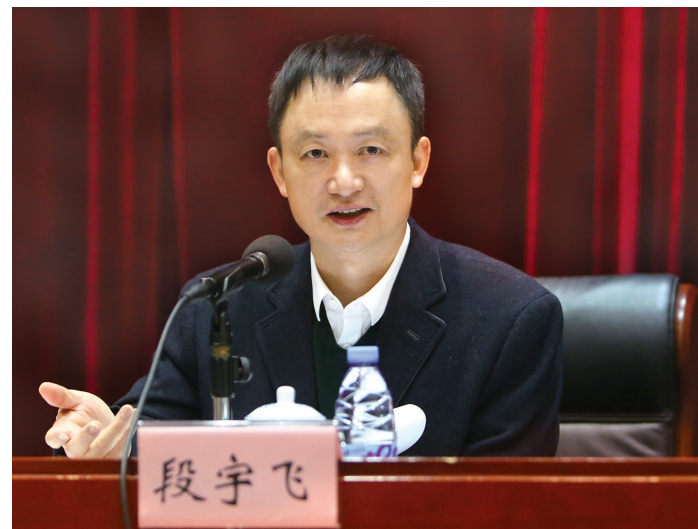
图为省卫生健康委党组书记、主任段宇飞作工作报告

编者按:1月18日,2019年全省卫生健康工作会议在广州召开。省卫生健康委党组书记、主任段宇飞在会上作题为《深入学习贯彻习近平总书记重要讲话精神,努力推动健康广东建设再上新台阶》的工作报告。这份报告旗帜鲜明、求真务实、催人奋进,对动员全省卫生健康系统凝心聚力、锐意进取、狠抓落实,努力推动健康广东建设再上新台阶,为我省全面建成小康社会收官打下坚实的健康基础具有重要意义。