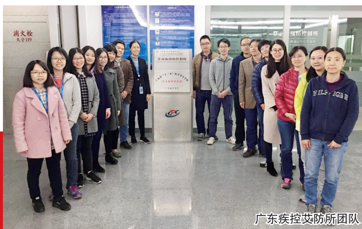
广东疾控艾防所团队

女医师14名。面对防治艾滋病的全球难题,她们走在前面,争当防艾探索者;她们深入娱乐和监管场所等地开展宣教干预,甘当健康传播者;她们不畏艰难,勇当援藏常驻地。三十年来,她们在艾滋病防治领域默默耕耘,辛勤汗水将她们浇灌成“铿锵玫瑰”。